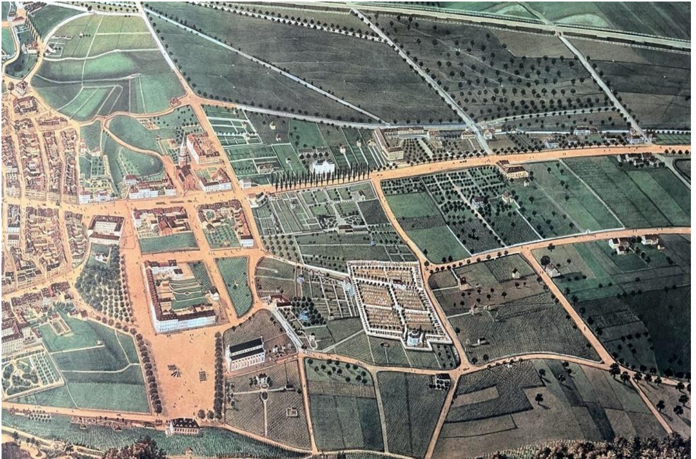
Der Lerchplan von 1852 zeigt, wie die Neuburg im 19. Jahrhundert wieder bebaut wurde.

Sie entstand als Erweiterung der auf die Zähringer zurückgehenden Kernstadt im Verlauf des 13. Jahrhunderts zusammen mit der Schneckenvorstadt im Süden und der Lehener oder Predigervorstadt im Westen.